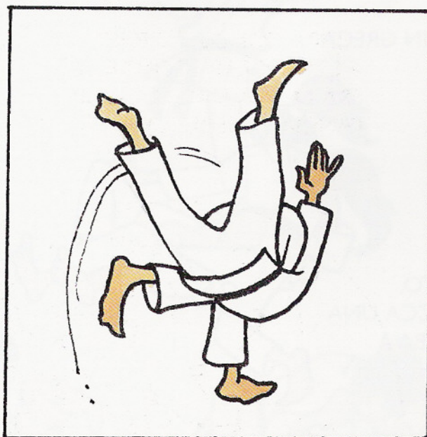
PROIETTANDOLO IN CERCHIO SOPRA LA PROPRIA ANCA