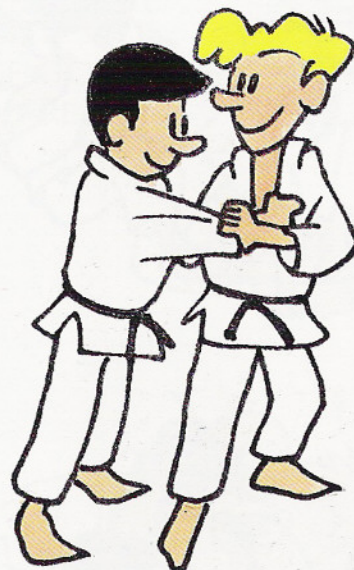
INDIETREGGIA COL PIEDE SINISTRO E DISTENDE LA GAMBA DESTRA DAVANTI ALLA DESTRA DI UKE